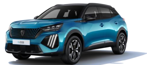
Bleu Obsession M0DP - Option