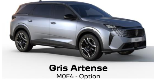
Gris Artense M0F4 - Option