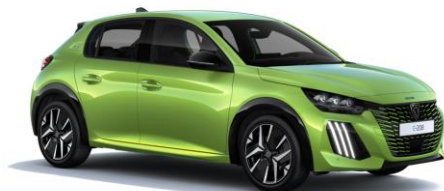
Jaune Agueda M0EQ – Option