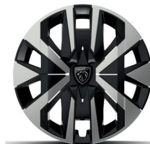
Jantes tôle 16" avec enjoliveurs MONTI Gris Eclat avec vernis brillant & noir grainé De série