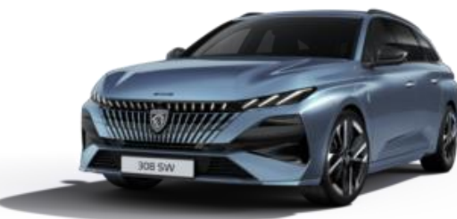
Bleu Ingaro M07K – Option (SV)