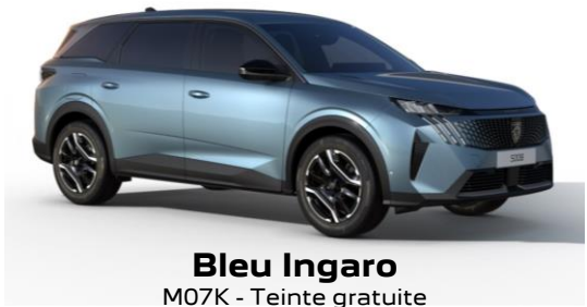
Bleu Ingaro M07K - Teinte gratuite