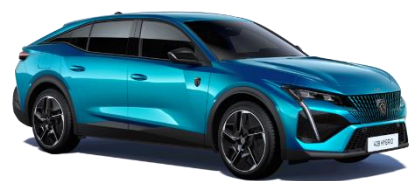
Bleu Obsession M0DP - Option