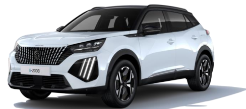
Blanc Okénite M0SU – Teinte gratuite