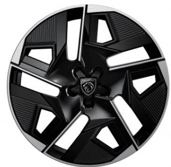
Jantes alliage 19" GRAPHITE Noir Onyx brillant avec cabochon en étoile et inserts noir mat