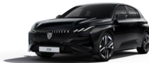
Noir Perla Nera M09V - Option