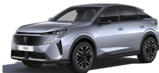
Gris Artense M0F4 - Option