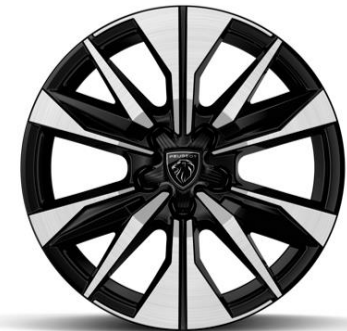
Jantes alliage 17" BANGKOK diamantées Bi-tons Noir Orbital De série sur Plug-in Hybrid