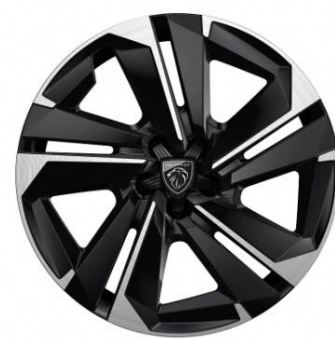
Jantes alliage 19" JASPE Noir Onyx brillant avec cabochon en étoile