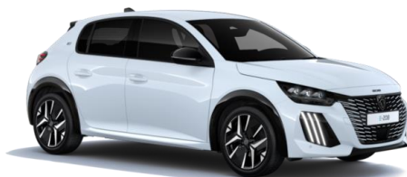
Blanc Okénite M0SU – Teinte gratuite