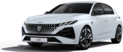
Blanc Okénite M0SU – Teinte gratuite