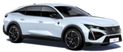
Blanc Okénite M0SU – Teinte gratuite