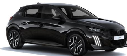
Noir Perla Nera M09V - Option