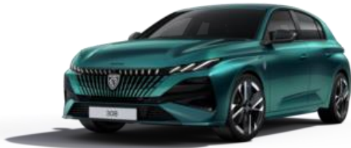
Bleu Lagoa M0KH - Option