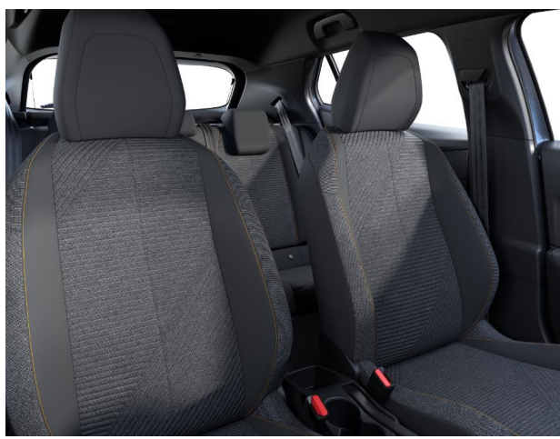
Sellerie tissu RENZO, accompagnement Rimini, surpiqûres Orange Sunrise G9FX