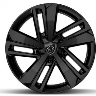
Jantes alliage 16" AUCKLAND Noir brillant De série sur Hybrid & Diesel