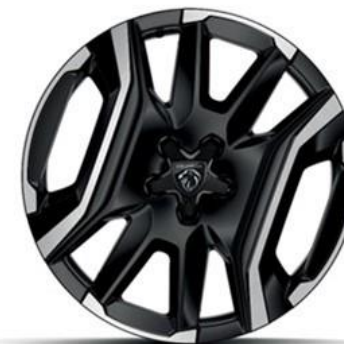
Jantes alliage 19'' diamantées LULEA Noir Orbital, vernis brillant De série sur Hybride rechargeable