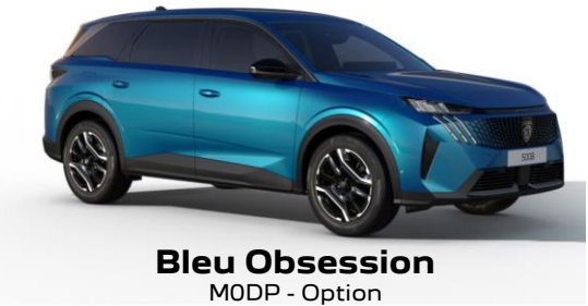
Bleu Obsession M0DP - Option