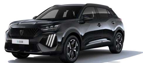
Noir Perla Nera M09V - Option