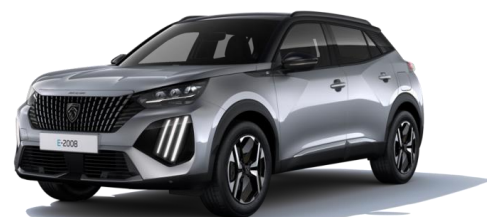
Gris Artense M0F4 - Option