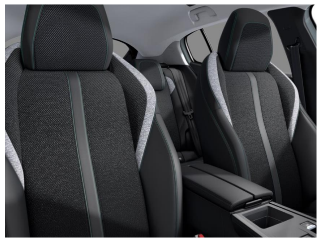
Sellerie tri-matières TEP / tissu « Falgo », surpiqûres Bleu D9FX