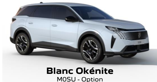
Blanc Okénite M0SU - Option