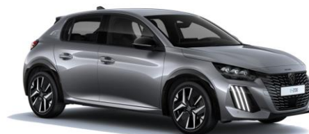
Gris Artense M0F4 - Option