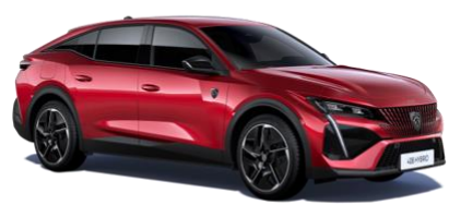
Rouge Elixir M5VH - Option