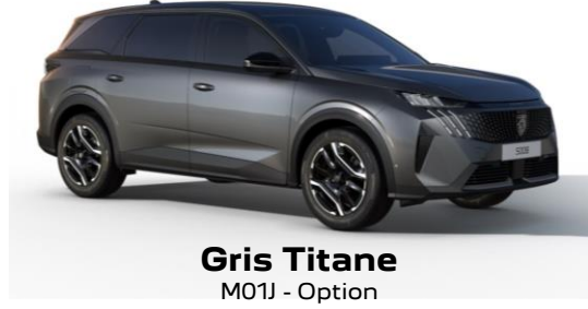
Gris Titane M01J - Option