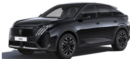
Noir Perla Nera