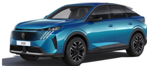
Bleu Obsession MODP – Teinte gratuite