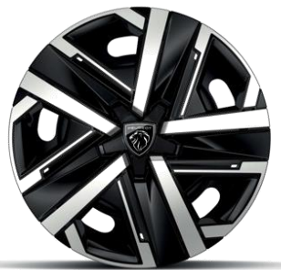
Jantes tôle 16" avec enjoliveurs SILOM Gris Eclat & Noir Orbitat, vernis mat De série