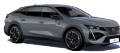
Gris Sélénium M0LD - Option