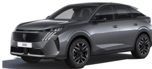
Gris Titane M01J - Option