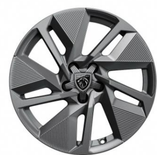
Jantes alliage 17" SILEX Gris Anthracite brillant avec cabochon en étoile