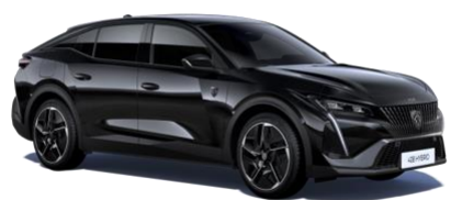
Noir Perla Nera M09V - Option