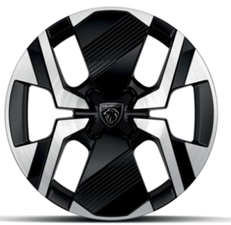
Jantes alliage 17" diamantées KARAKOY bi-tons Noir Onyx et vernis brillant Avec option Pneumatiques All Seasons 3PMSF