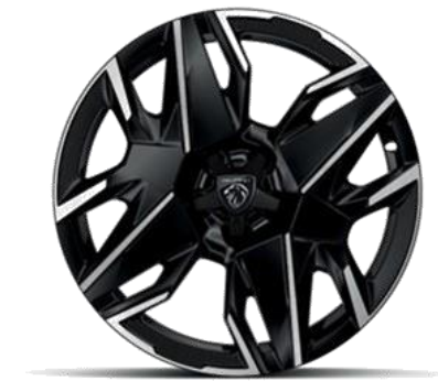
Jantes alliage 19" diamantées BREDA Noir Orbital, vernis brillant De série sur hybride