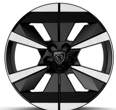
Jantes alliage 18" SEATTLE diamantées Bi-tons Noir Onyx De série sur Électrique