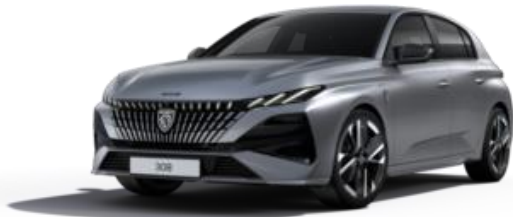
Gris Artense M0F4 - Option