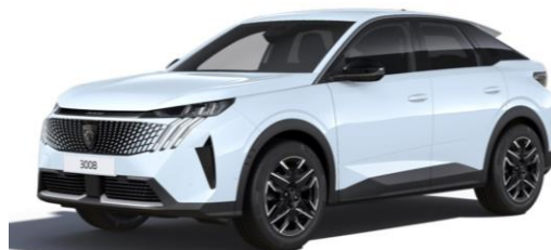
Blanc Okénite MOSU - Option