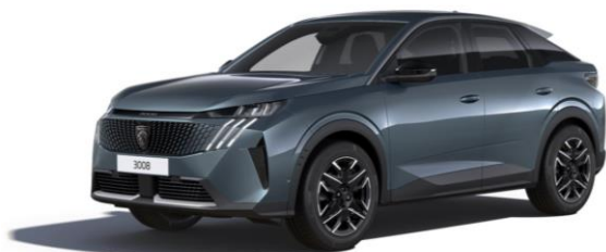
Bleu Ingaro M07K - Option