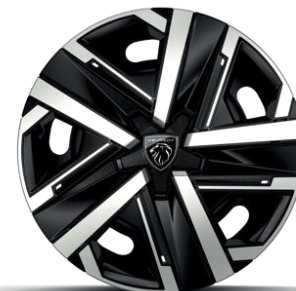
Jantes tôle 16" avec enjoliveurs SILOM Gris Eclat & Noir Orbitat, vernis mat De série