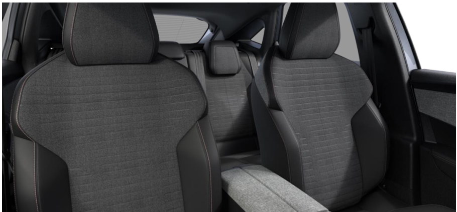
Sellerie tissu CRISPY embossé, accompagnement TEP Isabella, écharpe tissu RIMINI chiné, surpiqûres Quartz