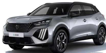
Gris Artense M0F4 - Option