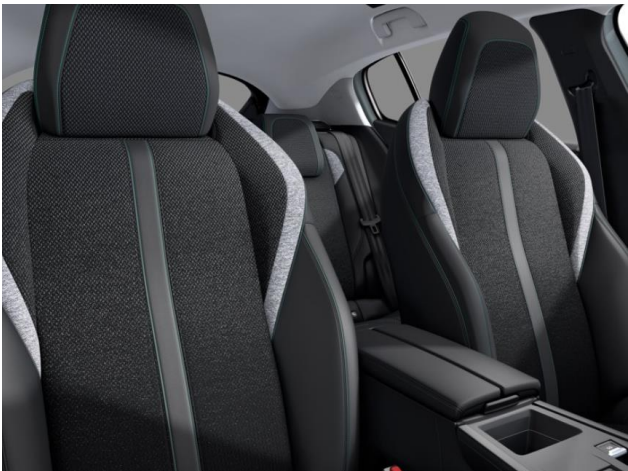
Sellerie tri-matières TEP / tissu « Falgo », surpiqûres Bleu D9FX