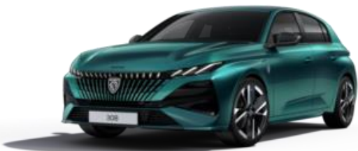
Bleu Lagoa M0KH - Option