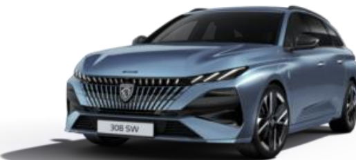
Bleu Ingaro M07K – Option (SV)