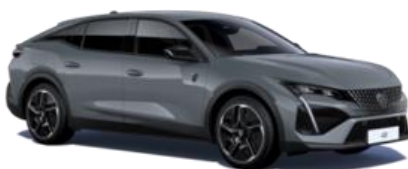
Gris Sélénium M0LD - Option