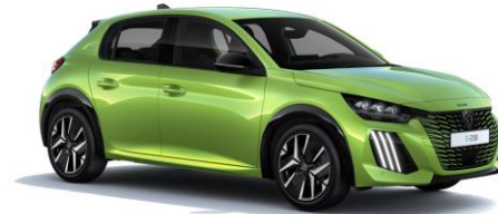
Jaune Agueda M0EQ – Option