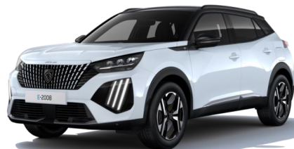
Blanc Okénite M0SU – Teinte gratuite