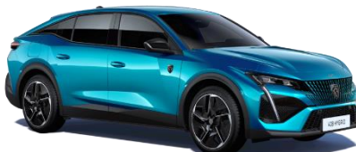
Bleu Obsession M0DP - Option