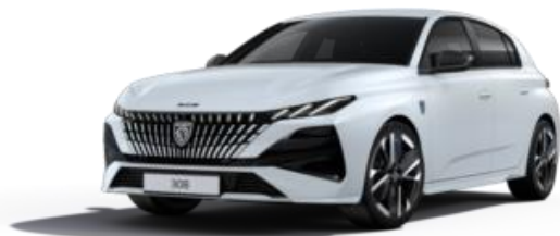
Blanc Okénite M0SU – Teinte gratuite