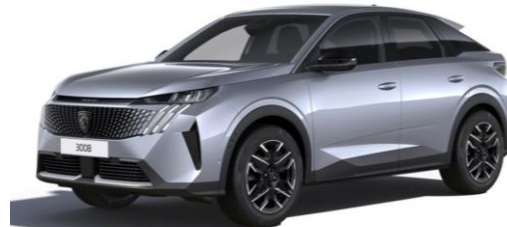
Gris Artense M0F4 - Option