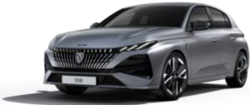
Gris Artense M0F4 - Option