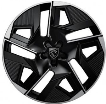
Jantes alliage 19" GRAPHITE Noir Onyx brillant avec cabochon en étoile et inserts noir mat