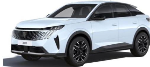
Blanc Okénite M0SU - Option