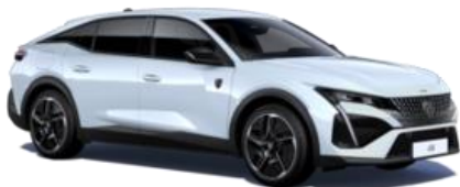
Blanc Okénite M0SU – Teinte gratuite