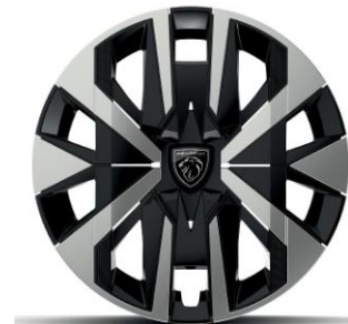
Jantes tôle 16" avec enjoliveurs MONTI Gris Eclat avec vernis brillant & noir grainé De série