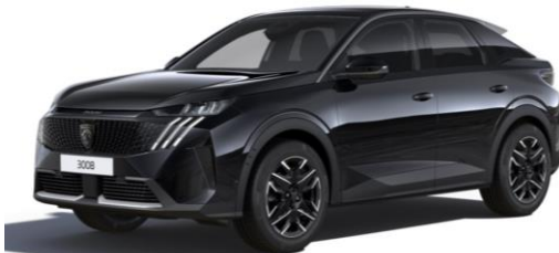
Noir Perla Nera M09V - Option