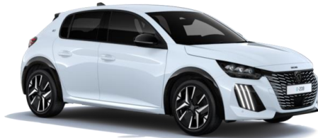
Blanc Okénite M0SU – Teinte gratuite