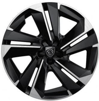
Jantes alliage 19" JASPE Noir Onyx brillant avec cabochon en étoile