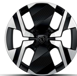
Jantes alliage 17" diamantées KARAKOY bi-tons Noir Onyx et vernis brillant Avec option Pneumatiques All Seasons 3PMSF