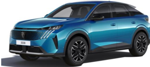
Bleu Obsession M0DP – Teinte gratuite