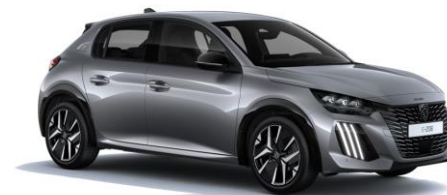
Gris Artense M0F4 - Option