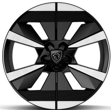
Jantes alliage 18" SEATTLE diamantées Bi-tons Noir Onyx De série sur Électrique