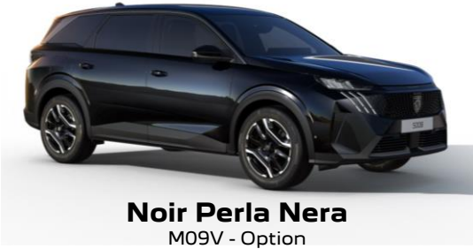
Noir Perla Nera