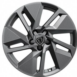
Jantes alliage 17" SILEX Gris Anthracite brillant avec cabochon en étoile