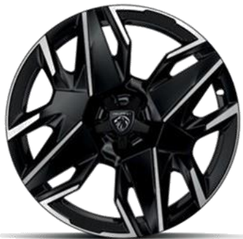
Jantes alliage 19" diamantées

BREDA Noir Orbital, vernis brillant De série sur hybride