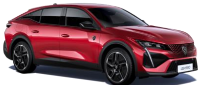
Rouge Elixir M5VH - Option