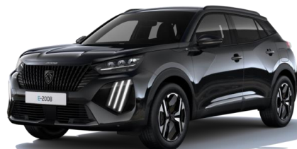
Noir Perla Nera M09V - Option