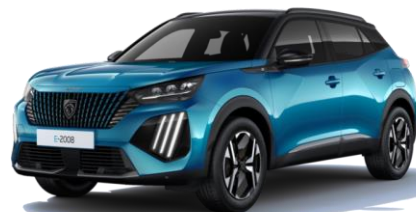
Bleu Obsession M0DP - Option