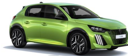
Jaune Agueda M0EQ - Option