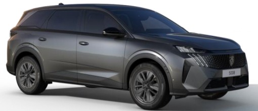
Gris Titane M01J - Option