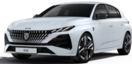
Blanc Okénite MOSU - Teinte gratuite