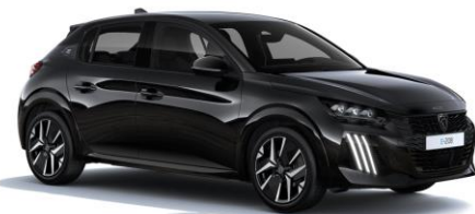
Noir Perla Nera M09V - Option