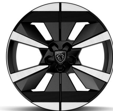
Jantes alliage 18" SEATTLE diamantées Bi-tons Noir Onyx De série sur Électrique