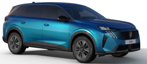
Bleu Obsession M0DP - Teinte gratuite