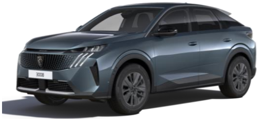
Bleu Ingaro M07K - Option