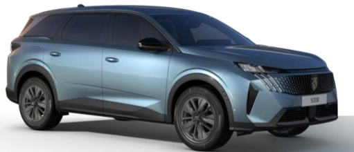
Bleu Ingaro M07K - Option