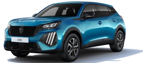
Bleu Obsession MODP - Option