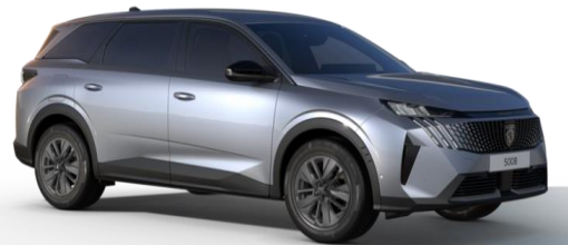
Gris Artense M0F4 - Option