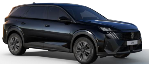
Noir Perla Nera M09V - Option