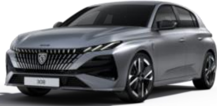
Gris Artense M0F4 - Option