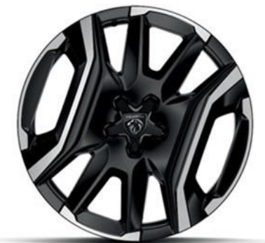
Jantes alliage 19" diamantées LULEA Noir Orbital, vernis brillant De série sur Hybride rechargeable et Électriques