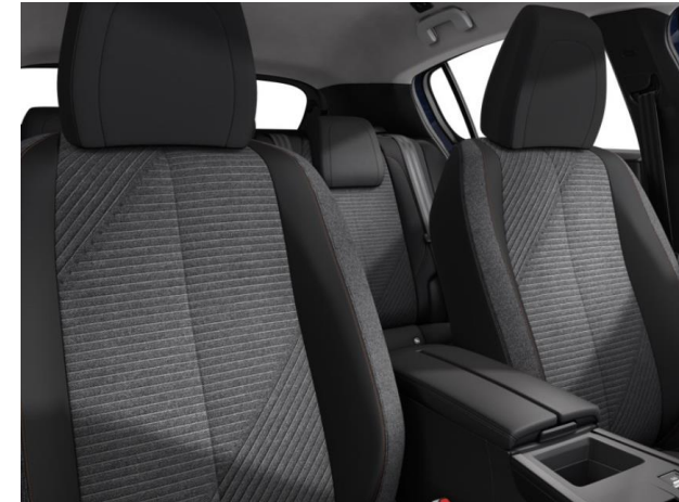
Sellerie tissu RENZO, accompagnement Baladin chiné, surpiqûres Orange Sunset G9FX