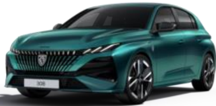
Bleu Lagoa MOKH - Option