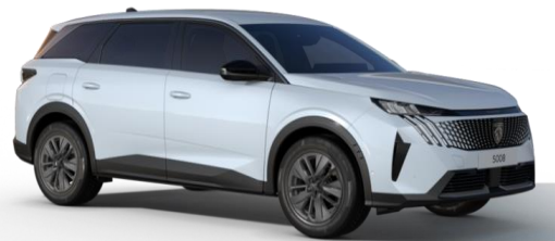
Blanc Okénite M0SU - Option