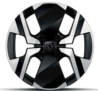
Jantes alliage 17" diamantées KARAKOY bi-tons Noir Onyx et vernis brillant Avec option Pneumatiques All Seasons 3PMSF