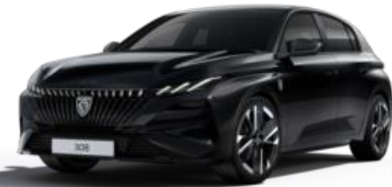
Noir Perla Nera M09V - Option