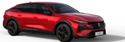
Rouge Elixir M5VH - Option