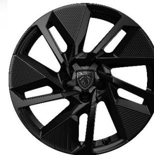
Jantes alliage 17" SILEX monoton Noir Onyx brillant De série sur Hybrid