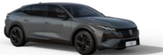
Gris Sélénium M0LD - Option