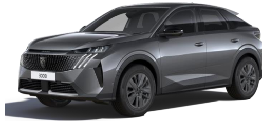
Gris Titane M01J - Option