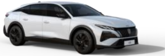
Blanc Okénite M0SU – Teinte gratuite