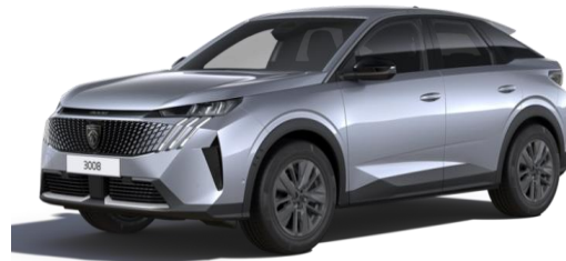
Gris Artense M0F4 - Option