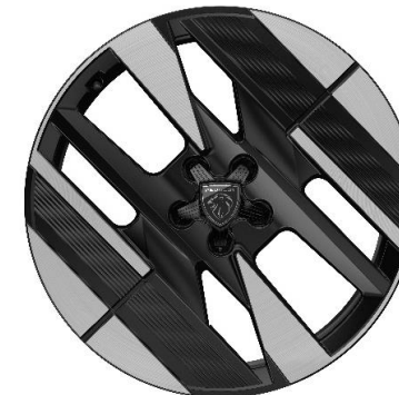
Jantes alliage 19" ADAKITE biton Noir Orbital brillant, inserts Noir Orbital mat De série sur Plug-in Hybrid En option sur Hybrid