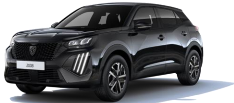
Noir Perla Nera M09V - Option