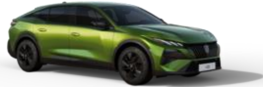
Vert Fascinant M0F9 - Option