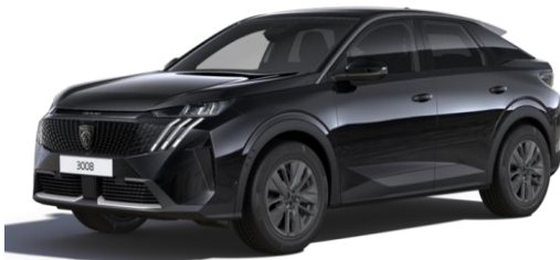
Noir Perla Nera M09V - Option