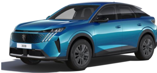
Bleu Obsession M0DP – Teinte gratuite