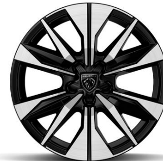
Jantes alliage 17" BANGKOK diamantées Bi-tons Noir Orbital De série sur Plug-in Hybrid