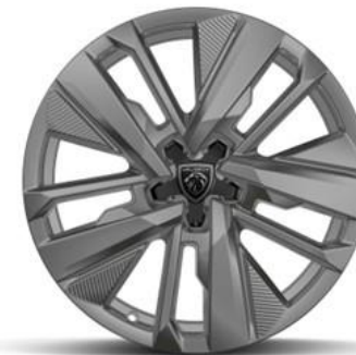
Jantes alliage 18" BASEL De série sur hybride