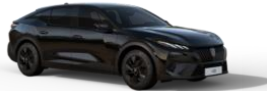
Noir Perla Nera M09V - Option