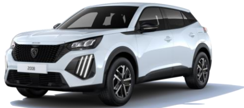
Blanc Okénite MOSU – Teinte gratuite