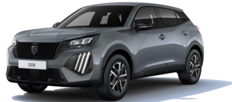
Gris Sélénium MOLD - Option