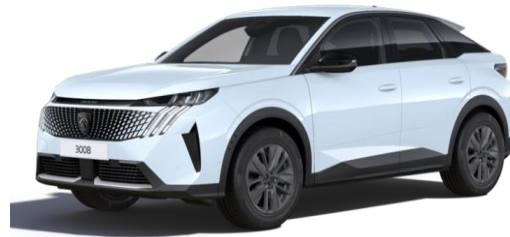
Blanc Okénite MOSU - Option