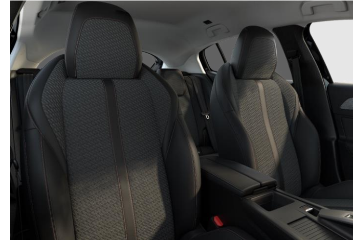
Sellerie tri-matière tissu gris TREMEZZO embossé avec accompagnement TEP Isabella Mistral et surpiqûres rose Quartz Z7FX