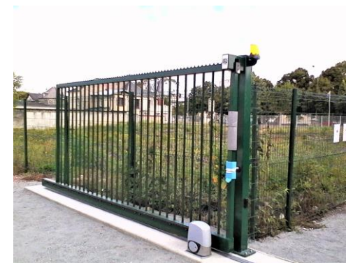
Motorisation de portail