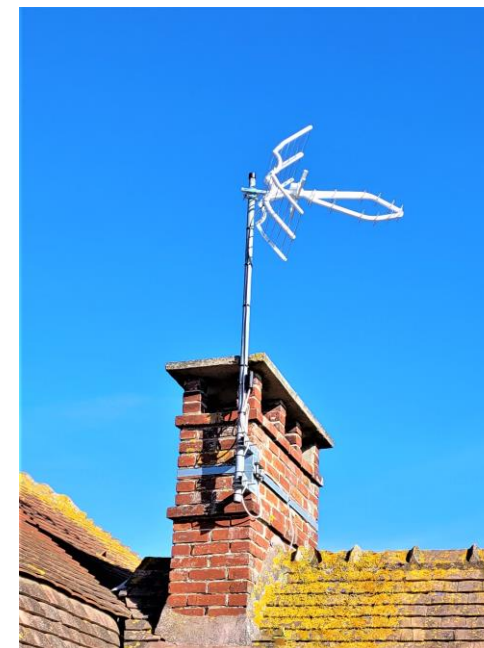
Installation antenne TNT