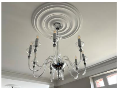
Pose de lustrerie